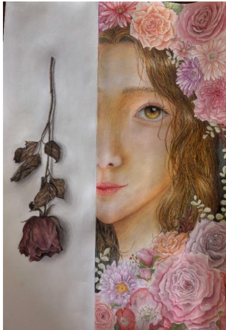
作品タイトル：『永久の輪郭』 武田（2U）